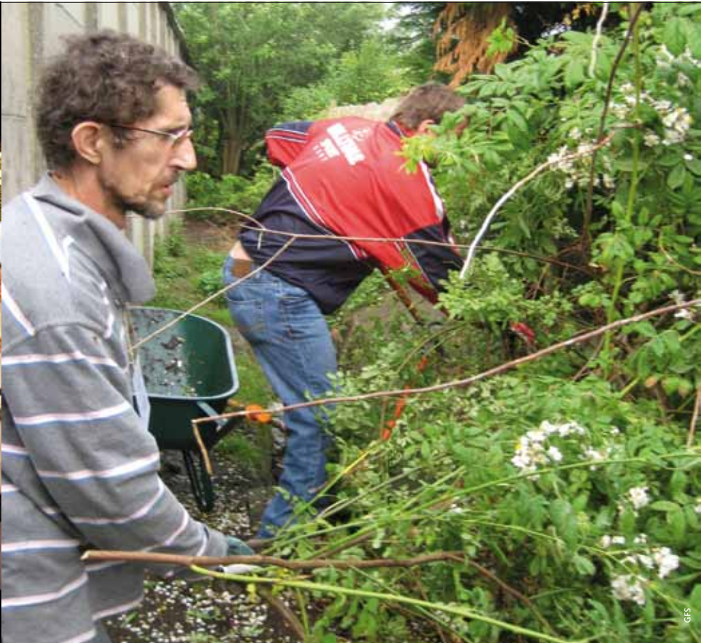
In de Bloemekenswijk bieden allochtone vrouwen eten aan en in Nieuw-Gent ruimen de bewoners zelf de gracht.