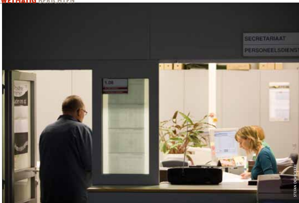
Als gevolg van het sectorale akkoord 2008-2013 heeft de Vlaamse regering het Rechtspositiebesluit aangepast.