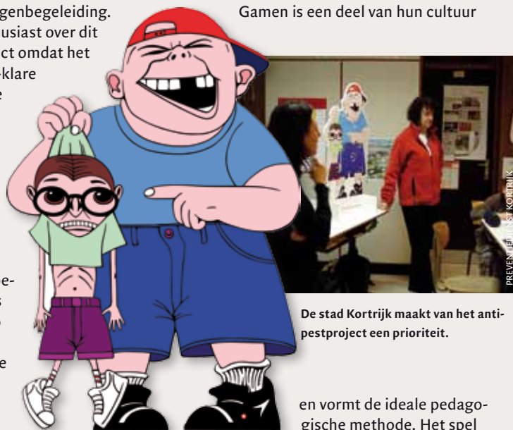
De stad Kortrijk maakt van het antipestproject een prioriteit.

en vormt de ideale pedagogische methode. Het spel R.E.-pest situeert zich in het digitale Kortrijk. De speler begint als leerling in een futuristische school. Tijdens zijn tocht door Kortopia krijgt hij met allerlei pestsituaties te maken waarop hij moet reageren. Hij bepaalt zelf de volgorde van de opdrachten maar is wel verplicht enkele opdrachten uit te voeren vooraleer hij naar een volgend level kan gaan. De gamer verdient punten door gepast te reageren op pestsituaties. Beslist hij mee te pesten, dan raakt hij na een tijdje bewusteloos en wordt hij met de ziekenwagen afgevoerd.